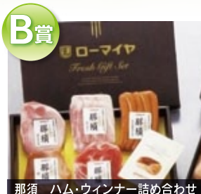
B賞 那須 ハム・ウィンナー詰め合わせ