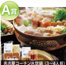
A賞 名古屋コーチン炊鍋 (3~4人前)