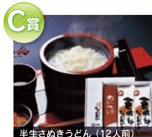
C賞 半生さめぎうどん (12人前)

※上の銀の部分削ってください。※あたりが出たら、上記の商品と引換えいたします。※一組につき1つとさせていただきます。※商品は食品につき後日、ご自宅に配送いたします。 ※数量は十分に用意していますが、万一品切れの際は同等の商品でご容赦ください。※期間中、ご来場アンケートにお答えいただいた方が対象となります。